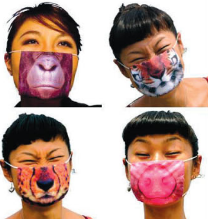
מסכות נשימה שנמכרו ביפאן בתקופת מגפת הסארס, בעיצוב סטודיו סמירה בון, יפאן