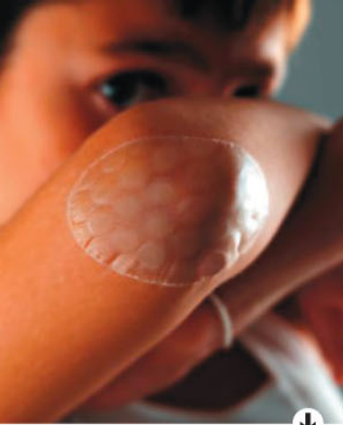
Compeed X-TREME Flex - פלסטר להגנה על יבלות ושלפוחיות, בעיצוב יאן מרקוסן

Bio International פנימיים לסוב לים מאלרגיות